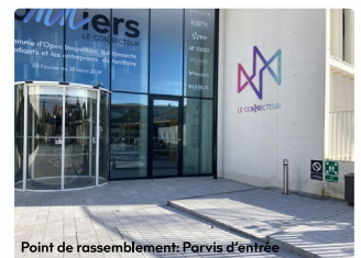
Point de rassemblement: Parvis d'entrée

Suivez les responsables de l'évacuation munis d'un dossard et d'un brassard « Serre file ». Ne faites jamais demi-tour. Respectez les consignes données par l'équipe d'évacuation.